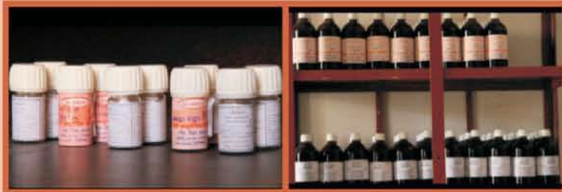
सेवाभावी रसायनशाला में उपलब्ध बहुमूल्य औषधियाँ

अपेक्षा है कि जैन विश्व भारती इस सेवा इकाई में सेवा देने के लिए समाज के ऐसे लोग सामने आएँ जो आयुर्वेद में विशेषज्ञ हों और इस कार्य में रुचि रखते हों। वे रसायनशाला की गतिविधियों में सक्रिय योगदान देकर यहाँ के क्रियाकलापों तथा उत्पादों को उचित सम्मान दिलाने में योग्य भूत बनें।