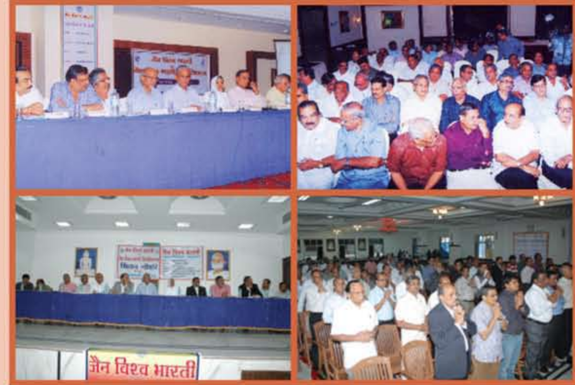
चेन्नई एवं बंगलुरु में आयोजित संगोष्ठी में मंचस्थ पदाधिकारीगण एवं उपस्थित श्रावक समाज

चेन्नई एवं बंगलुरु में जैन विश्व भारती एवं जैन विश्व भारती विश्वविद्यालय पर चिंतन गोष्ठी आयोजित