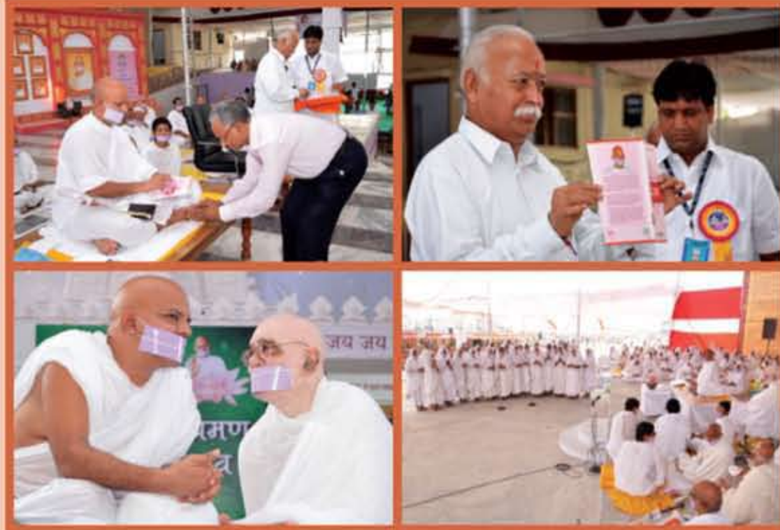
आचार्य महाश्रमण अमृत महोत्सव के रोमांचकारी क्षण

जैन विश्व भारती आचार्य महाश्रमण के सत्साहित्य को जन-जन को उपलब्ध करवाकर एवं अधिकतम प्रचार-प्रसार एवं प्रकाशन के संकल्प के साथ अमृत महोत्सव के पावन अवसर आचार्यप्रवर को अपनी श्रद्धासिक्त अभिवंदना करती है।